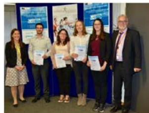
Preisverleihung bei der IHK Regensburg